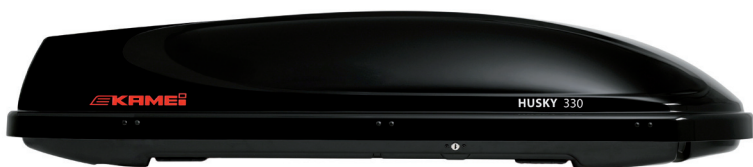
Husky 330 schwarz-hochglänzend