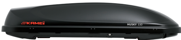
Husky 330 schwarz-matt

Die Husky 330 ist in den Farben schwarz-matt und schwarz-hochglänzend erhältlich. Sie hat 330 Liter Rauminhalt und bietet somit Platz für Ihre (Reise-)Utensilien. Die Husky 330 wird mit wenigen Handgriffen mit einer Komfort-Schiebe-Befestigung am Dachträger befestigt. Mit den 90mm U-Bügeln können besonders hohe und breite Trägerprofile verwendet werden. Die Öffnung der Box erfolgt von rechts.